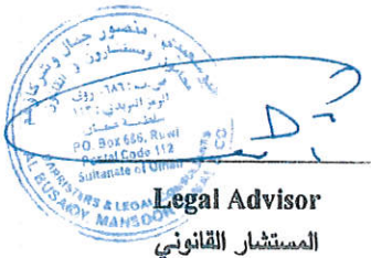
Legal Advisor المستشار القانوني